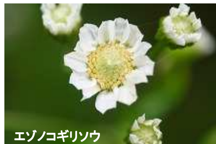
エゾノコギリソウ

本州中部以北から北海道、千島、樺太、カムチャッカ、東シベリアにかけて分布するエゾノコギリソウは、北地の草原に生える多年草です。高さは10～85cmほどになります。葉は長楕円形～披針状線形で、長さは3～7cm、巾5～11mmで、縁には細かいきょ歯があり、無柄で、基部はなかば茎を抱きます。花は7～8月に咲きます。頭花は白色で、散房状に多数つきます。総苞は半球形で長さ5mm、密に絹毛があります。舌状花は2列に並び、12～19個あります。宮城県では、石巻市網地島や田代島などに見られます。