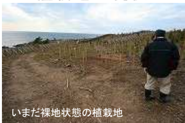
いまだ裸地状態の植栽地