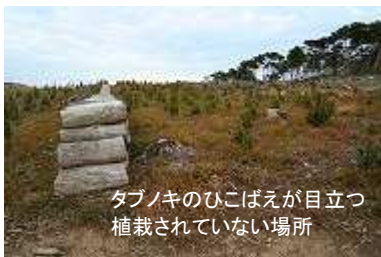
タブノキのひこばえが目立つ 植栽されていない場所