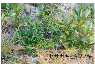
ヒサカキとタブノキ