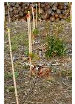
植栽したタブノキ(枯死)と 切り株から出たひこばえ

伐採したものを片付けただけでまだ植栽されていない場所ではいろいろな樹木のひこばえが出ています。タブノキや他の樹木の多く生えていた場所は、なぜ伐採したのか疑問が残ります。＜タブノキの林でなぜいけないのか＞ひこばえが沢山出ている場所は、植栽せずにそのまま放置しておく方が良いのではと思います。